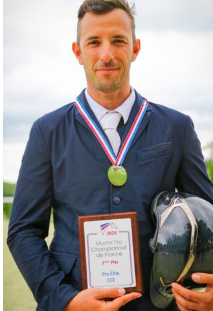
3ème championnat de France pro élite CCE