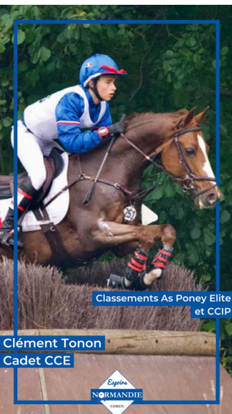
Classements As Pony Elite et CCIP

Ainsi, le samedi 26 octobre 2024 les Espoirs se retrouverons au Pôle International du Cheval pour l'annuelle journée de cohésion. Au programme : un atelier massage équin / préparation physique, un atelier grooming, une activité de team building ainsi que des séries d'interviews !